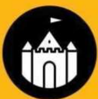
SITES ET MONUMENTS