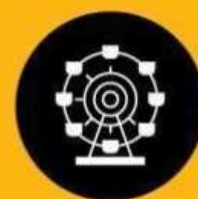
DÉTENTE & LOISIRS