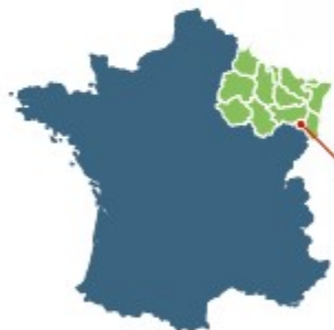
Ballons de la Haute-Vogerie