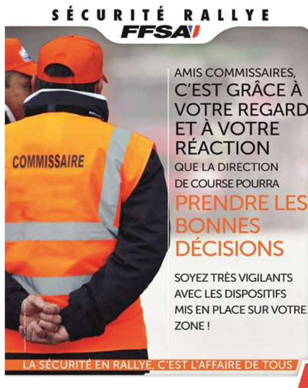
Tableau d'Honneur 2025